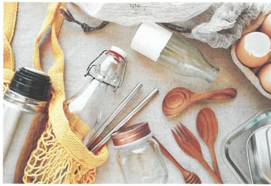
ALLES NACHFÜLLBAR Wasser- und Kaffeegenuss bleibt mit Glasflasche und Thermoskanne ganz umweltfreundlich